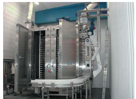
Skallfrysing før slicing